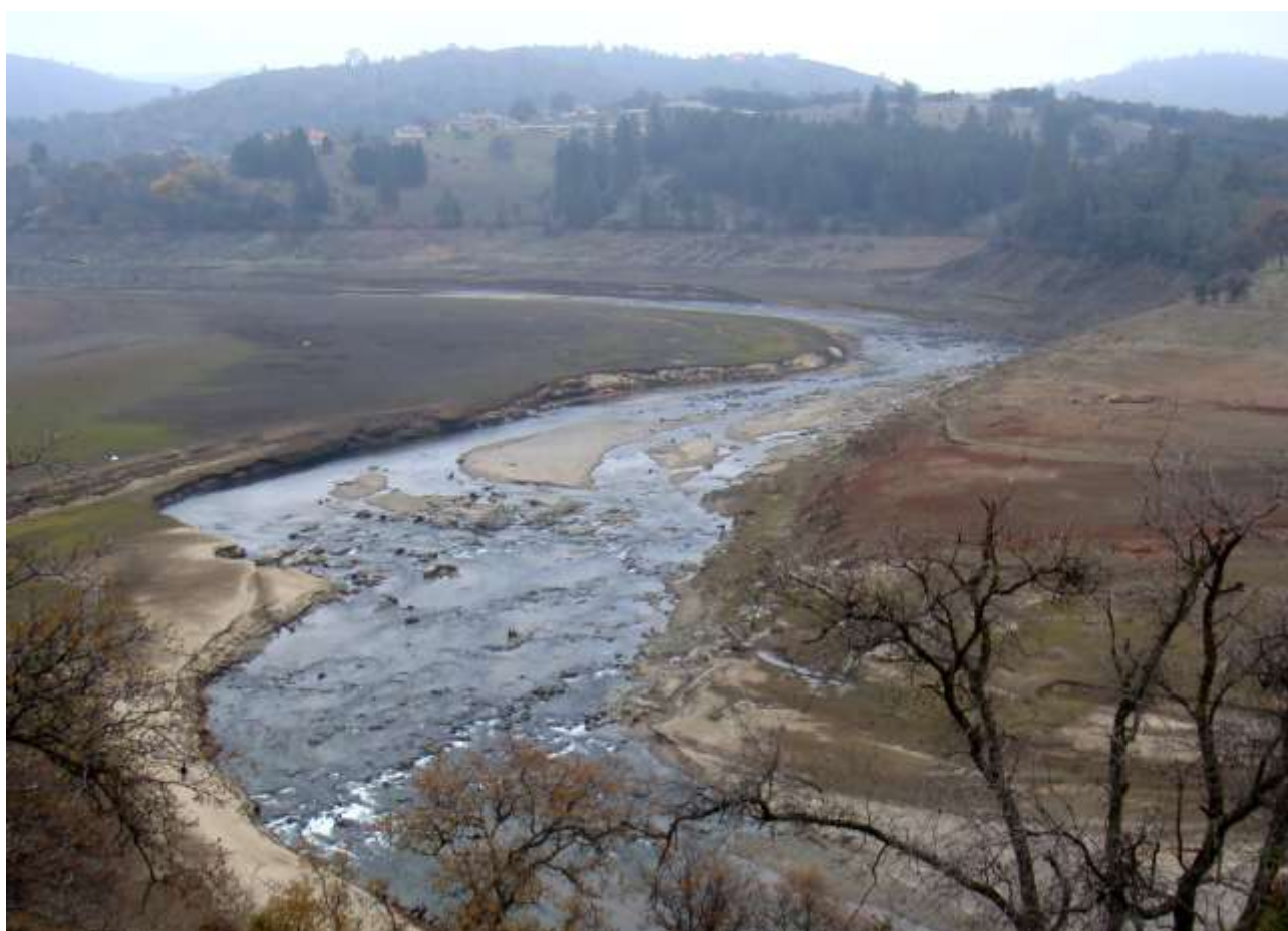
Figur 3 En reetableret Gudenå vil betyde genfødsel af et helt unikt og enestående naturområde i Danmark