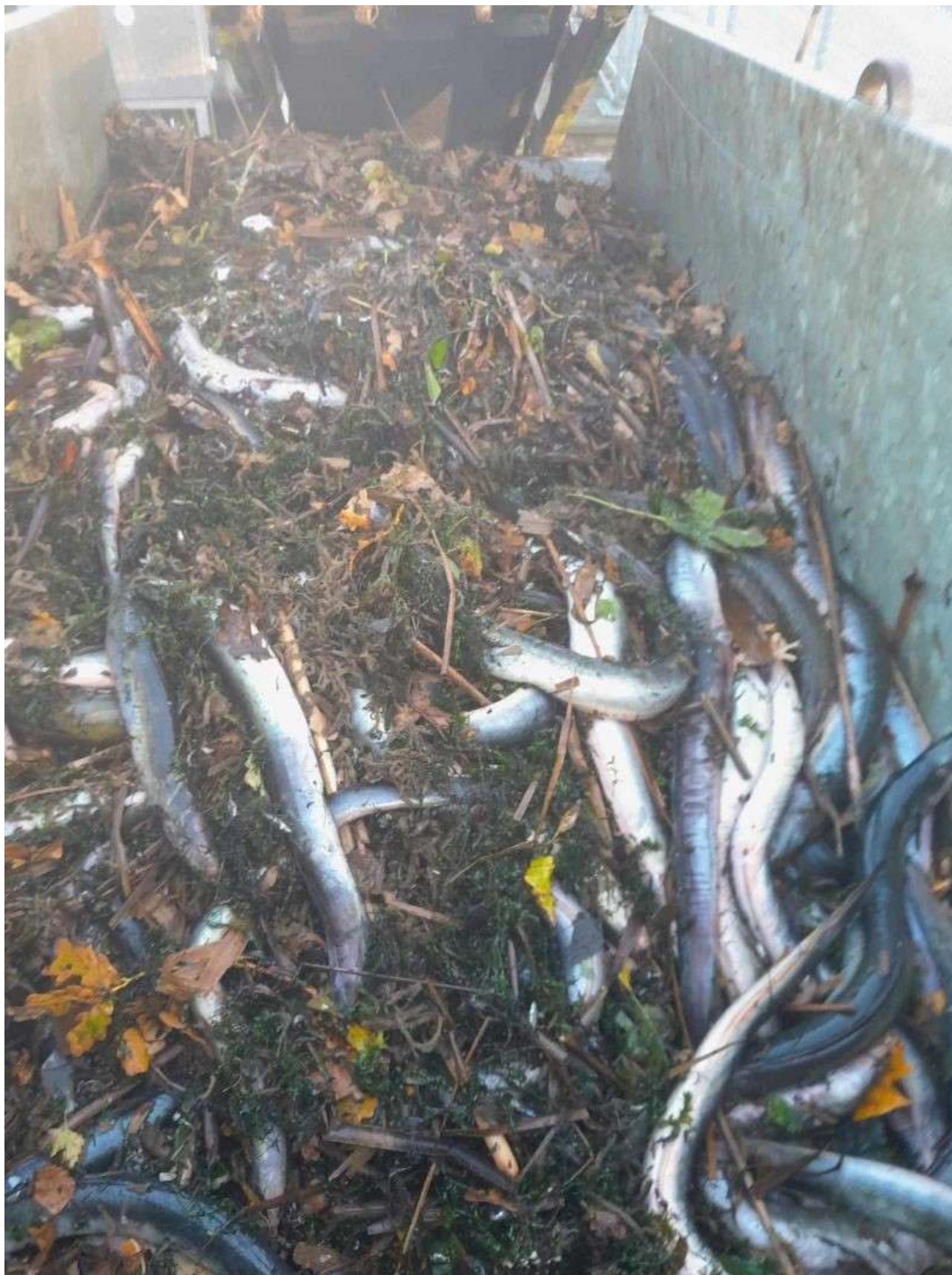
Figur 2 Tusindvis af den udryddelsestruede ål dør hvert år i Tangeværkets riste Foto: Kurt Levring, oktober 2024